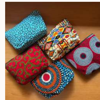
Neceseres de tela