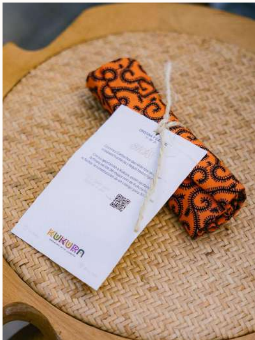
Tote bags para todos los invitados