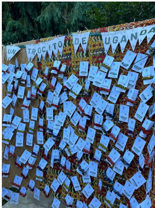
Regalos en una boda tipo cóctel