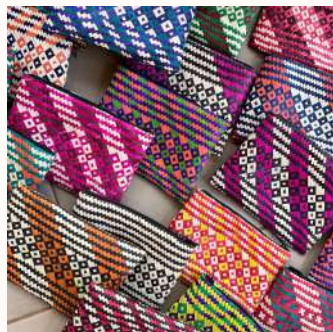
Neceseres de caña