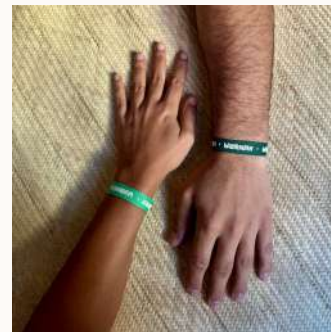
Pulseras de tela